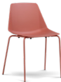
cadeira 4 pés