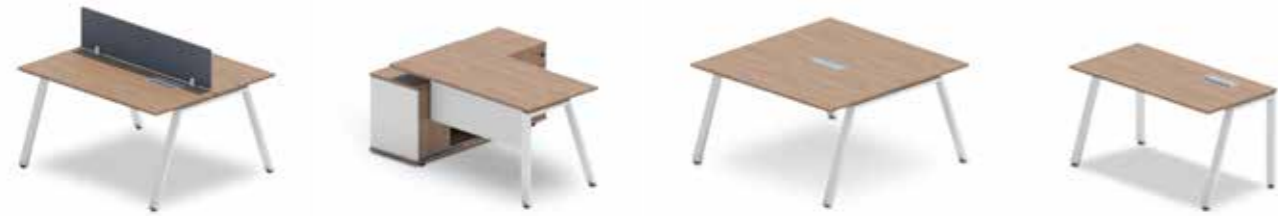
estação de trabalho dupla