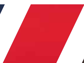
90 - VERMELHO