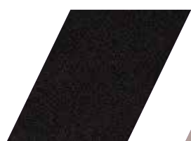
648 - PRETO