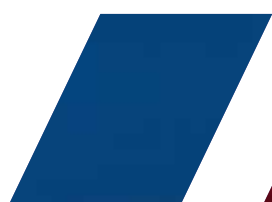
113 - AZUL