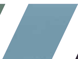
667 - AZUL HARMONIA