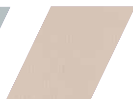
660 - CAMELO