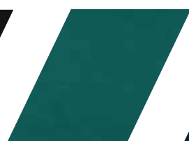
122 - VERDE CLARO