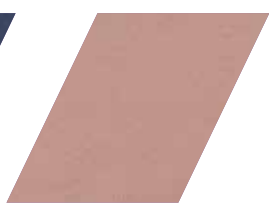
670 - ROSE CLOUD

*imagens meramente ilustrativas, tonalidade pode variar de acordo com o device utilizado para visualização.