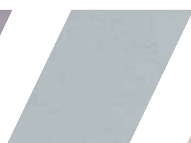
663 - BERILO