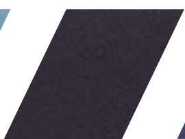
669 - GRAFITE