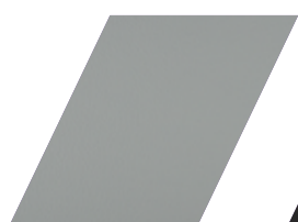
84 - CINZA