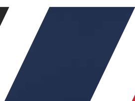
89 - AZUL MARINHO