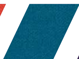
662 - LAC IZNIK