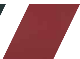
618 - BORDÔ