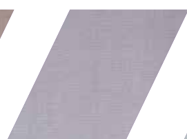
873 - CINZA