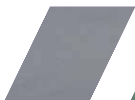
182 - CINZA CLARO