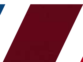
115 - BORDÔ