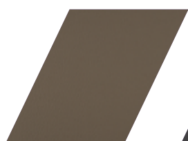
620 - BRONZE