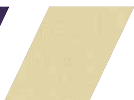
658 - SOLAR

*imagens meramente ilustrativas, tonalidade pode variar de acordo com o device utilizado para visualização.