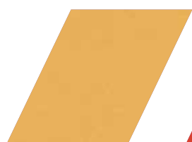
659 - CRUSH