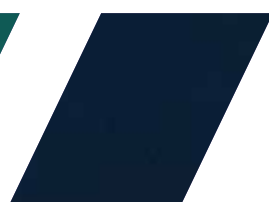
181 - AZUL MARINHO