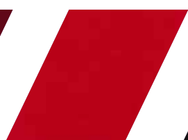
116 - VERMELHO