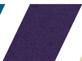
661 - PÚRPURA