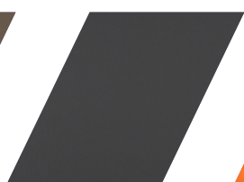
621 - TITANIUM