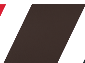
602 - MARROM