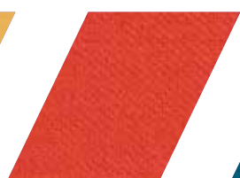
664 - ESCARLATE