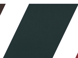
617 - MUSGO