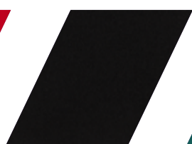
119 - PRETO