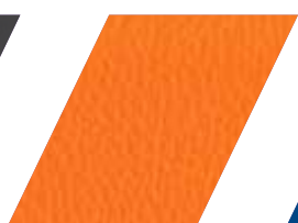
645 - LARANJA