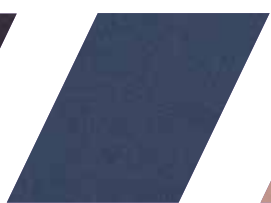
668 - AZUL LONA