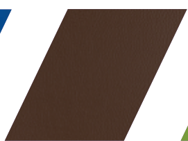
656 - MARROM