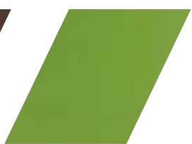
657 - VERDE

*imagens meramente ilustrativas, tonalidade pode variar de acordo com o device utilizado para visualização.