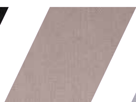
646 - TAUPE